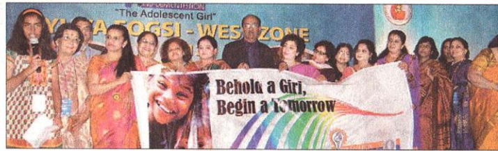
Members of FOGSI inaugurating the workshop.

Recently, the government set up the Adolescent Reproductive Sexual